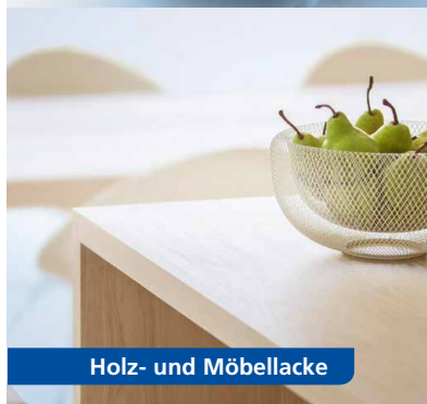
Holz- und Möbellacke